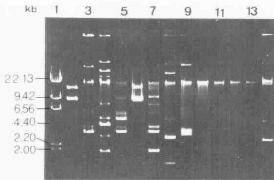
Figure 1. Plasmid profiles of Escherichia coli strains analyzed by 0.7% agarose gel electrophoresis. Lane 1: HindIII digested \lambda DNA serving as molecular weight marker, lane 2→14 represent plasmid DNAs isolated from strain EWD 299, ETEC 01, ETEC 02, ETEC 03 (STI), ETEC 04, ETEC 05 (STI), ETEC 06 (STI), ETEC 07 (STI+LT1), ETEC 08, E 7, E 7, E 8, and E 9, respectively.

基因的 ETEC 菌株為 lane 5, 7, 8 及 9 部分, 包括 ETEC03, 05, 06, 07 等菌株, 這些菌株, 具有共同大小的質體 DNA, 如大小接近 22 kb 者。圖一中質體 DNA 分子量之判定, 係以 HindIII 水解之 \lambda DNA 為標準而比較, 而非為 supercoil 狀之 DNA 標準; 由於在抽取、製備質體 DNA 的過程, 一般亦不能保證所製備之質體 DNA 為完整之 supercoil, 因此 Ichiyama 等人 (17) 在分析金黃色葡萄球菌 ( Staphylococcus aureus ) 的質體 DNA 時, 即以 \lambda DNA/HindIII 為標準分子量, 做為對比; 因此, 本研究所示之質體 DNA 分子量大小, 亦以 \lambda DNA/HindIII 為分子量指標而定之。然而, 我們必須指出; 本文所指稱之質體 DNA 分子量, 僅是以 \lambda DNA/HindIII 之 DNA 片段為分子量指標所得參考值, 不一定代表質體 DNA 在菌株中之確切分子量。